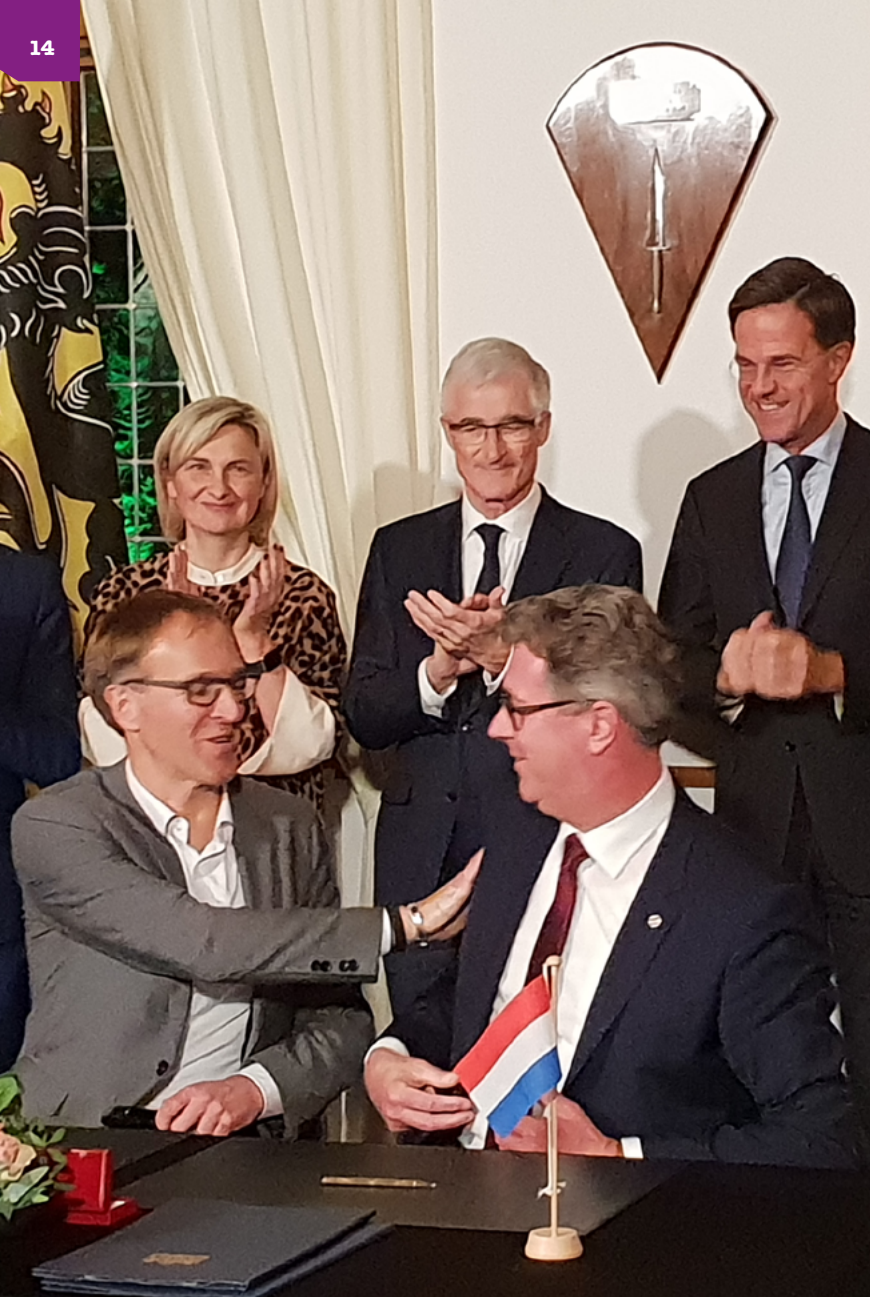
Ondertekening Vlaams-Nederlandse samenwerking Deltavraagstukken Universiteit Gent en Campus Zeeland