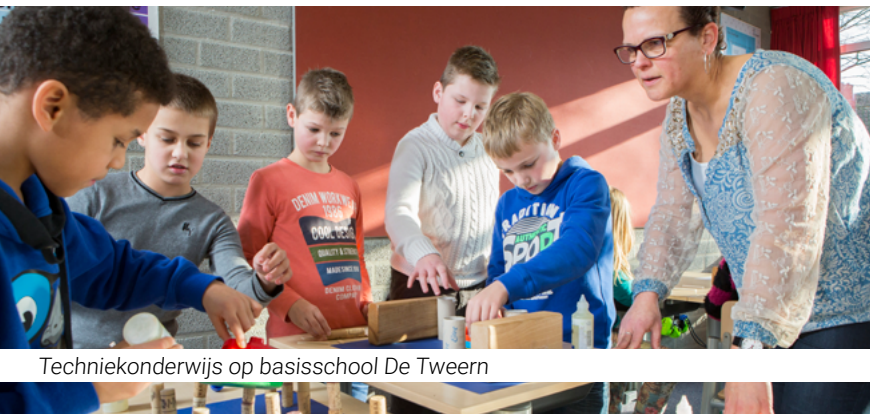
Techniekonderwijs op basisschool De Tweern

Met de komst van een Delta Kenniscentrum en Law Delta is het belangrijk om te bekijken hoe Campus Zeeland doorgaat. De Law Delta is een justitieel complex met een hoog beveiligde zittingslocatie (rechtbank een extra beveiligde inrichting (een gevangenis) en een overnachtingslocatie voor rechters en officieren. Hierbij hoort ook een Strategisch kenniscentrum Georganiseerde Ondernemende Criminaliteit. In 2021 zal de nieuwe koers van Campus Zeeland bepaald worden.