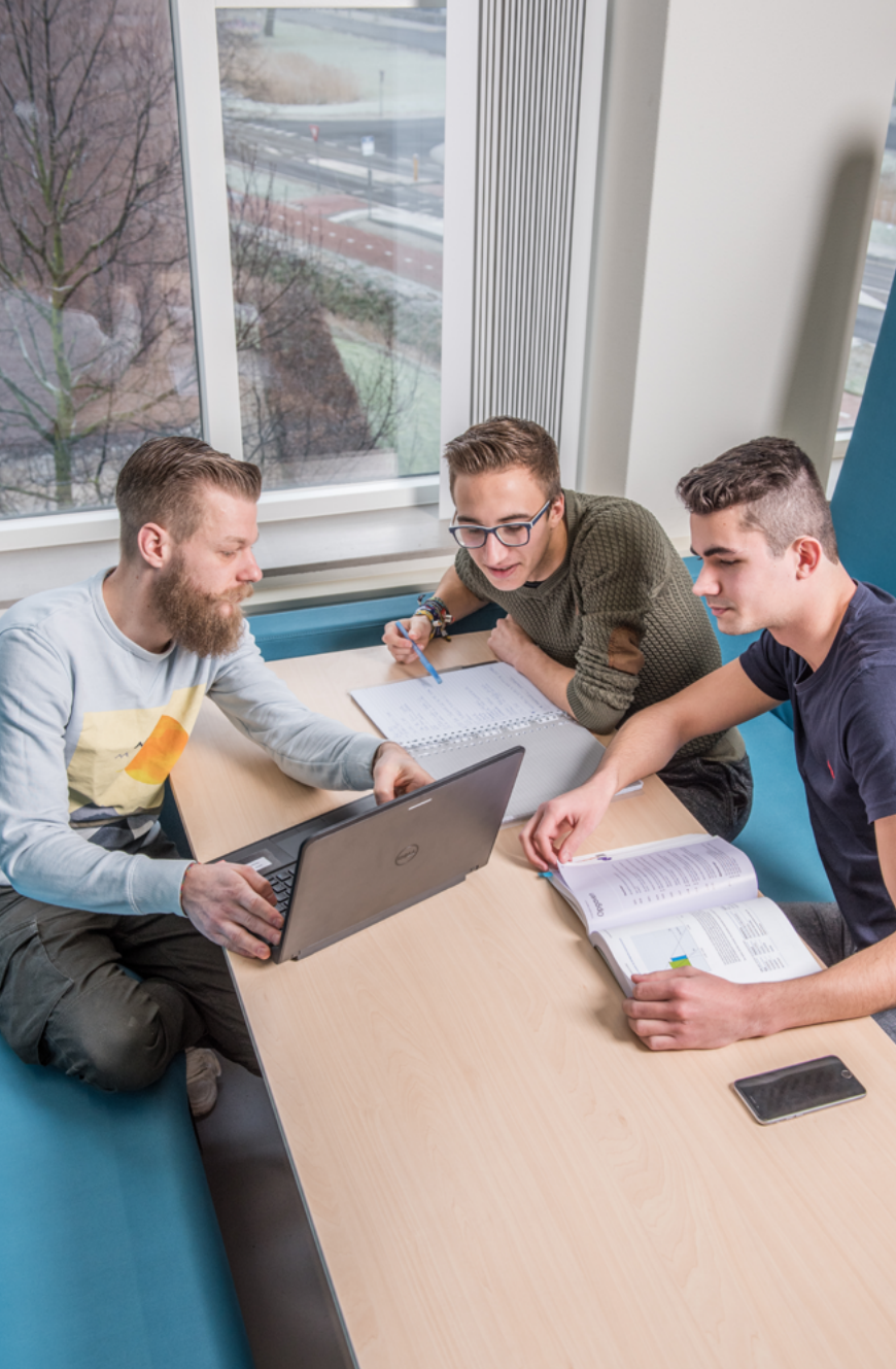
Studenten in overleg