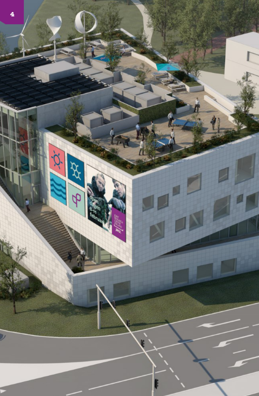
Artist impression Joint Research Center Zeeland